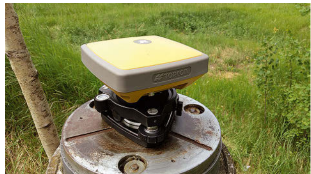
Рис. 4. Центр эталонных базисов при эксперименте

области, представлена на рис. 3, а внешний вид центров — на рис. 4.