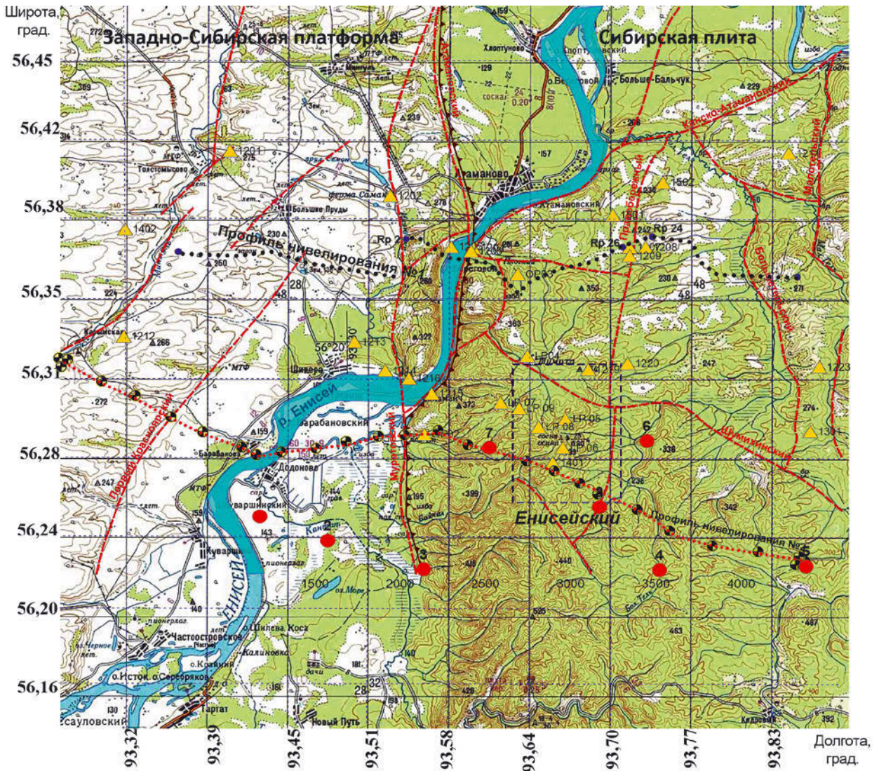
Рис. 2. Схема геодинамических наблюдений в 2019–2024 гг. Желтые треугольники – существующие ГНСС-пункты, красные кружки – новые ГНСС-пункты, черный пунктир – существующий профиль повторного нивелирования № 1, красный пунктир – новый профиль повторного нивелирования № 2