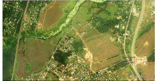
Рис. 3. Эталонный базис Федерального центра геодезии, картографии (Московская область). Красные линии — линии базиса. Желтые маркеры — пункты установки аппаратуры

Схема расположения эталонного базиса, расположенного в северной части Московской