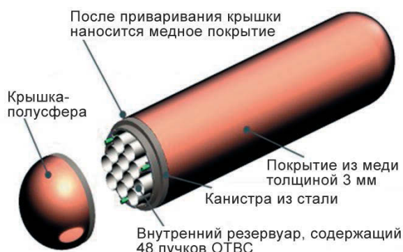
Рис. 1. Канадский проект упаковки для захоронения ОЯТ

В 2014 году NWMO представила новый проект упаковок ОЯТ, специально оптимизированный под конфигурацию ОТВС, выгружаемых из канадских реакторов CANDU. При полной загрузке одна такая упаковка длиной 2,5 м и диаметром 0,6 м, способная вместить 45 пучков ОТВС, будет весить около 2 800 кг. На поверхность стальной упаковки методом электролитического осаждения и холодного распыления планируется наносить 3-миллиметровый слой меди. Использование медного покрытия позволит повысить изолирующие характеристики упаковок, подверженных деформации под действием возникающих в ПГЗРО нагрузок. Проектные характеристики как самой канистры, так и ее крышки, имеющей форму полусферы, обеспечивают прочность конструкции, позволяя ей выдерживать давление окружающих горных пород, а также, с учетом возможности наступления нового ледникового периода, потенциальную нагрузку слоя льда толщиной до 3 км.