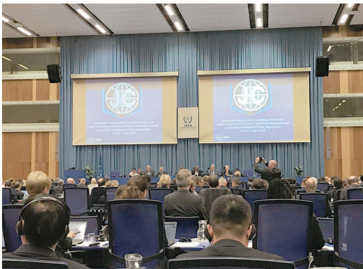
Открытие шестого Совещания Договаривающихся сторон по рассмотрению национальных Докладов в рамках Объединенной конвенции

Одним из наиболее значимых международных форумов, посвященных безопасному использованию атомной энергии, в котором Российская Федерация принимает активное участие, является Совещание Договаривающихся сторон по рассмотрению выполнения обязательств, вытекающих из «Объединенной конвенции о безопасности обращения с отработавшим ядерным топливом и о безопасности обращения с радиоактивными отходами».