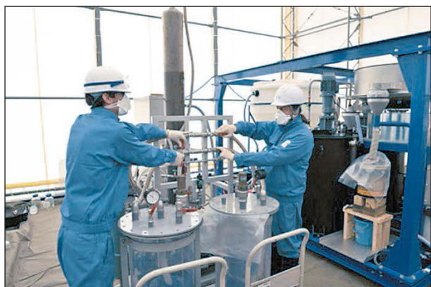
Рис. 3. Тестирование новой технологии дезактивации грунта

После аварии на АЭС Фукусима в марте 2011 года более 22 млн м 3 радиоактивно загрязненного грунта было удалено с поверхности земли в префектуре Фукусима. Удаленный грунт был размещен в гигантских пластиковых мешках и хранится на нескольких специально отведенных для этого площадках. Власти Японии пытаются найти наиболее эффективный способ удаления загрязняющих веществ из этого грунта.